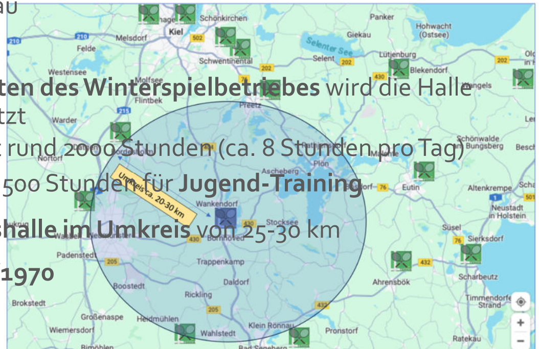
Tennishallen im Umkreis zur Tennishalle Wankendorf.docx