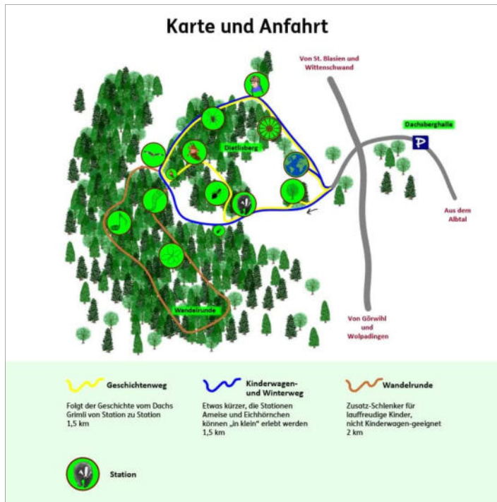
Dachs-Erlebnispfad im Schwarzwald