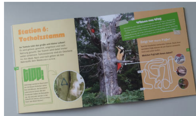
Naturschatz-suche im NP Lauenburgische Seen