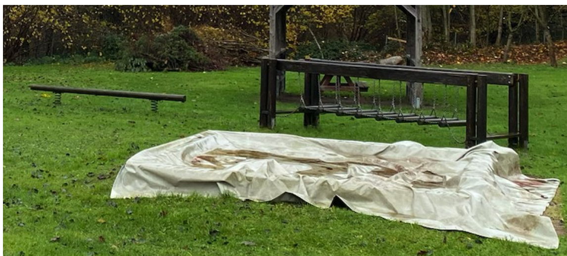
Sandkasten, Wackelbalken und Balancierbrücke