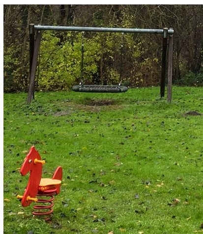
Nestschaukel und Wackeltier