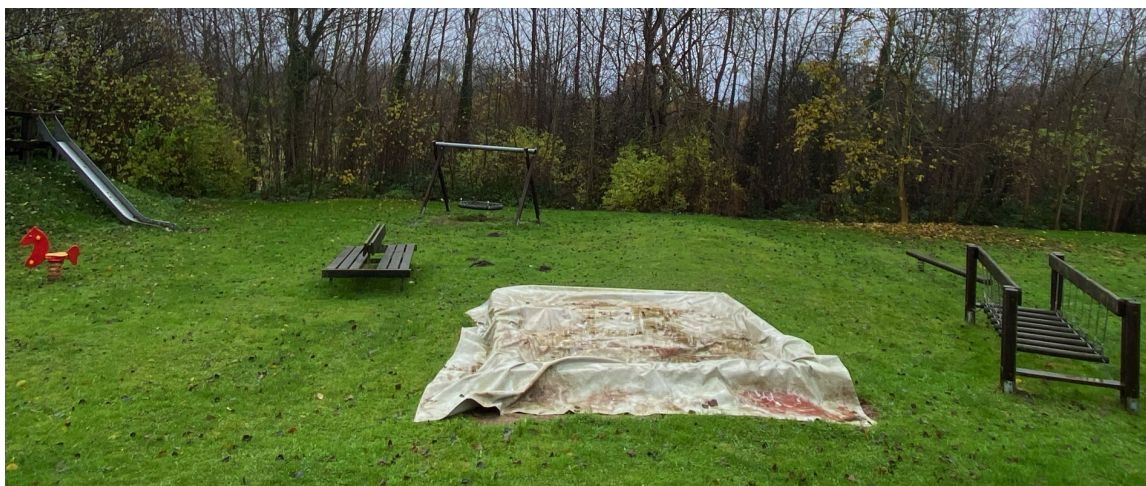
Rutsche, Nestschaukel, Sandkasten, Wackelbalken und Balanciergerät

zum Antrag der Gemeinde Honigsee auf Gewährung einer Zuwendung zur Umsetzung eines Kleinprojektes im Rahmen des GAK-Regionalbudgets