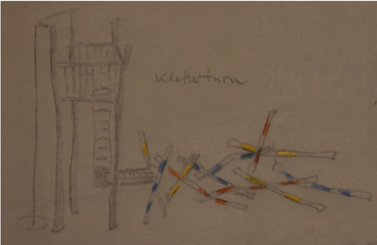
Kletterturm mit Kletterstangen (vorhandene Rutsche wird in den Turm integriert)