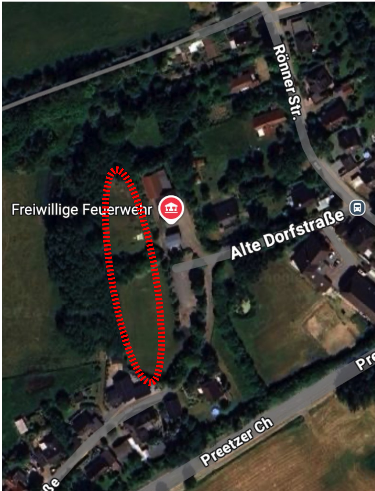
Lage des Grundstücks im Ortskern