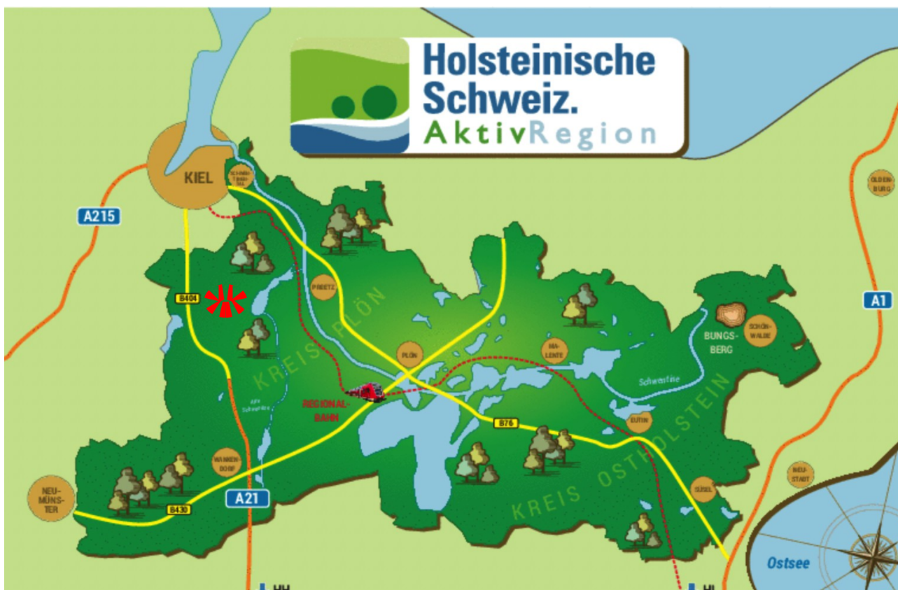
Lage von Honigsee in der AktivRegion Holsteinische Schweiz

zum Antrag der Gemeinde Honigsee auf Gewährung einer Zuwendung zur Umsetzung eines Kleinprojektes im Rahmen des GAK-Regionalbudgets