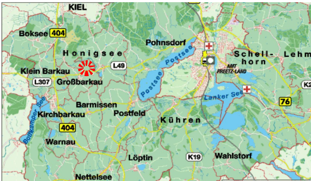
Lage der Gemeinde im Gebiet des Amt Preetz-Land